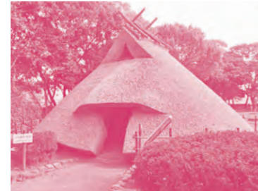
田能遺跡 弥生時代の住居や高床倉庫などを復元している。