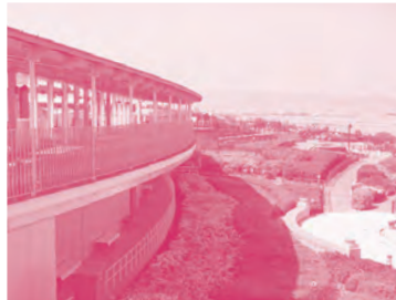
伊丹スカイパーク 連なった丘からは飛行機の離発着を間近に見ることができる。