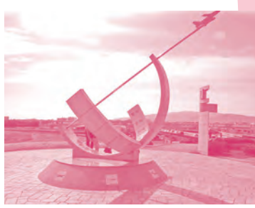
エア・フロント・オアシス 下河原 飛び立つ飛行機が真下から見えて迫力があります。